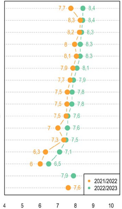
KUVIO 2. Lukiouudistuksen tavoitteiden osa-alueiden keskimääräinen saavuttaminen ensimmäisen ja toisen lukuvuoden päätteeksi (lukiot 2022, n = 142, rehtorit 2023, n = 153)

Ensimmäisen lukuvuoden tulokset viittaavat siihen, että etenkin kyselyssä kartoitettujen yhteistyömuotojen toteuttamiseen liittyi aluksi haasteita. Vuoden 2022 keväällä lukiot arvioivat onnistuneensa heikoiten yhteistyössä vapaan sivistystyön (6,0) ja ammatillisten oppilaitosten kanssa (6,3). Nämä yhteistyötahot oli huomioitu heikoiten myös paikallisten opetussuunnitelmien valmisteluvaiheessa (Saarinen ym. 2023, 56–57). Myös yhteistyö työelämän kanssa (7,0) sai lukioilta heikkoja arvosanoja muihin osa-alueisiin verrattuna.