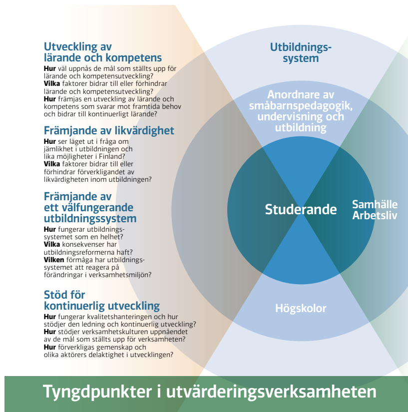
Figur 1. Tyngdpunkter i utvärderingsverksamheten 2020–2023

Figuren visar vilka tyngdpunkter som gäller för utvärderingsverksamheten under perioden 2020–2023. Av figuren framgår också de frågor som NCU genom varje tyngdpunkt strävar efter att ge svar på.