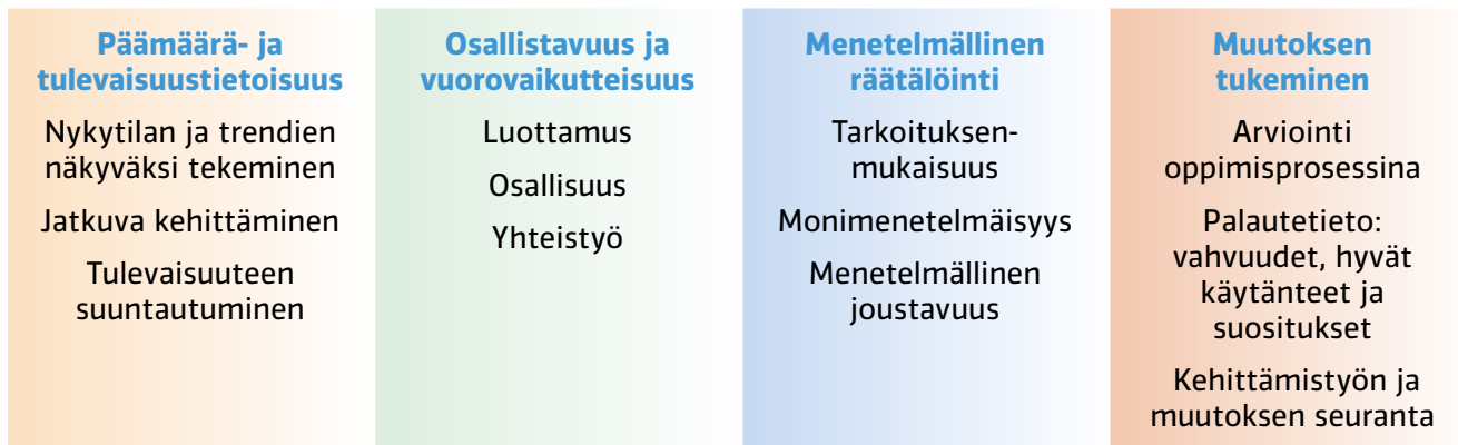
KUVIO 1. Kehittävän arvioinnin keskeisiä periaatteita Karvissa (vrt. Atjonen 2015)

Karvissa kehittävän arvioinnin tunnuspiirteiksi on määritelty arvioinnin päämäärä- ja tulevaisuustietoisuus, osallistavuus ja vuorovaikutteisuus, menetelmällinen räätälöinti ja muutoksen tukeminen.